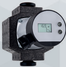
WITA Delta HE 35 LCD | HE 55 LCD