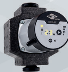
WITA Delta HE 35 LED | HE 55 LED