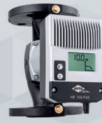
WITA Delta HE 75 F | HE 100 F HE 120 F