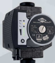
WITA Delta MIDI 40 | MIDI 60