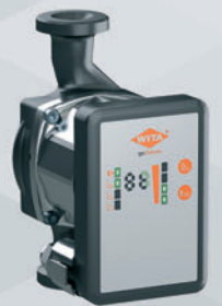
go.future 2 – 40 LED | 60 LED

Durch kompromisslose hohe Qualitätsstandards, gepaart mit den zahlreichen Anwendungsmöglichkeiten unserer Pumpen sind wir in der Lage, unseren Kunden für nahezu jeden Anwendungsbereich eine optimale Lösung anbieten zu können. Einsatz finden unsere Hocheffizienzpumpen in den Bereichen Heizungs-, Trinkwasser- und Solartechnik. Tagtäglich arbeitet die Forschungs- und Entwicklungsabteilung an neuen innovativen Lösungen, um dem Fachhandwerk auch in Zukunft den Alltag zu erleichtern.