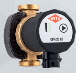
WITA UPH 20-KS